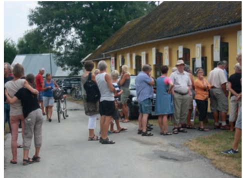
Omø Kulturdage