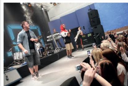
Slagelse Musikhus

Kosmorama - Algade 15, 4230 Skælskør www.kosmobio.dk