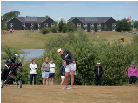
Spil golf i Slagelse eller Korsør

www.slagelse.dk/borger/kultur-natur-og-fritid