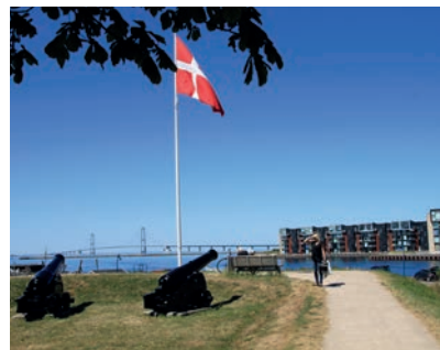
Udsigt fra Fæstningen Korsør