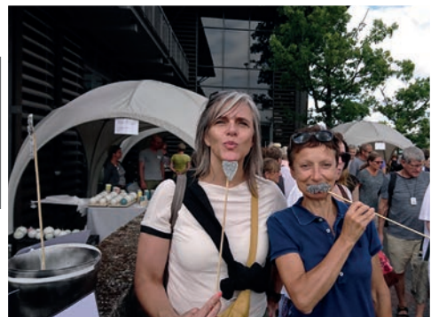
Keramikfestival i Skælskør