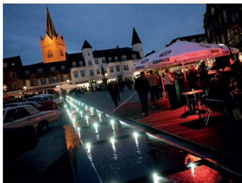
Sct. Michaels Nat i Slagelse