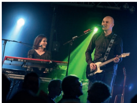
Slagelse Festuge / Foto: Evan Hemmingsen