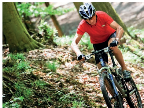
En tur i skoven / Foto: Colourbox