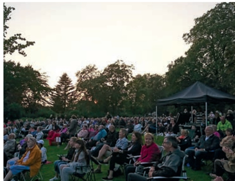
Picnickoncert i Anlægget i Slagelse