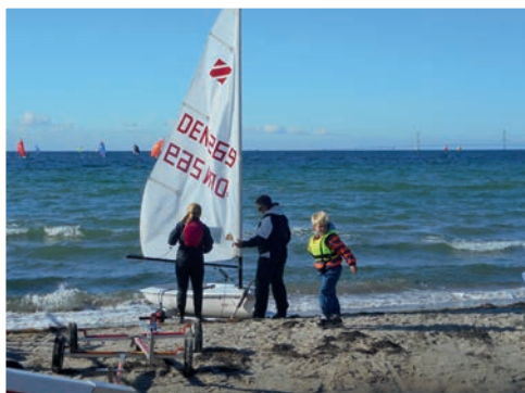
Harboe Cup ved Kobæk

På www.slagelsebib.dk kan du finde åbningstider, adresser og arrangementskalender.