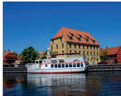
Turbåden Skælskør V