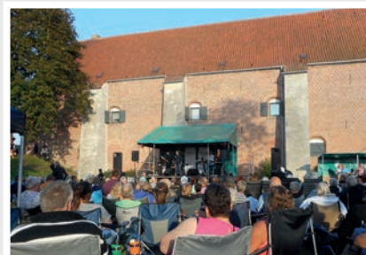
Picnickoncert, Fæstningen i Korsør