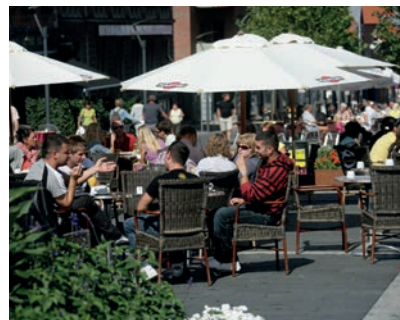
Caféliv i Slagelse

Korsør er en maritim købstad med vand til alle sider, og du skal ikke bevæge dig langt væk fra byen for at finde familievenlige sandstrande. Den gamle bydel står omkring havnen med flere små interimistiske restauranter, der også danner rammen om nogle af de mange events, der udspiller sig i den levende havneby året rundt.