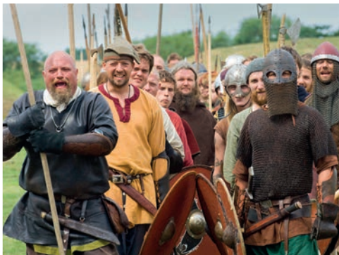
Vikingefestival på Trelleborg / Foto: Monica Sommerlund

Find din strand her - www.slagelse.dk/strande