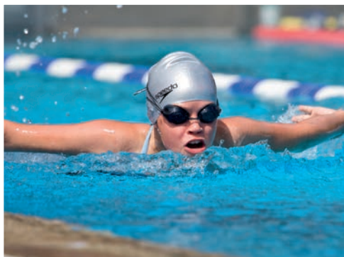
Svøm en tur i Korsør eller Slagelse