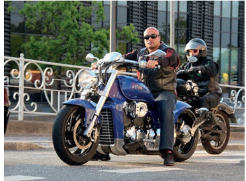
Drengerøvsaften i Skælskør