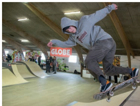
Skaterladen i Slagelse