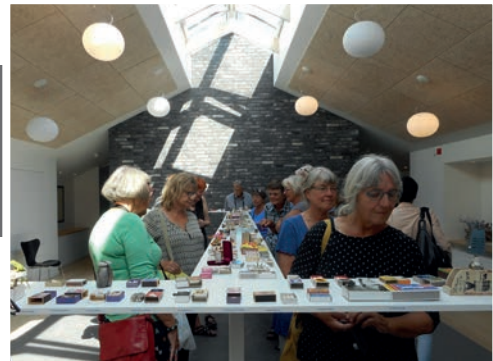
Udstilling på Guldagergaard